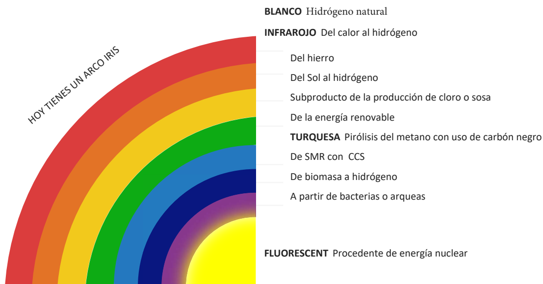
Figure 3. Un arco iris de colores de hidrógeno ilustrativo